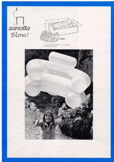
Blow – depliant 1988 per riedizione