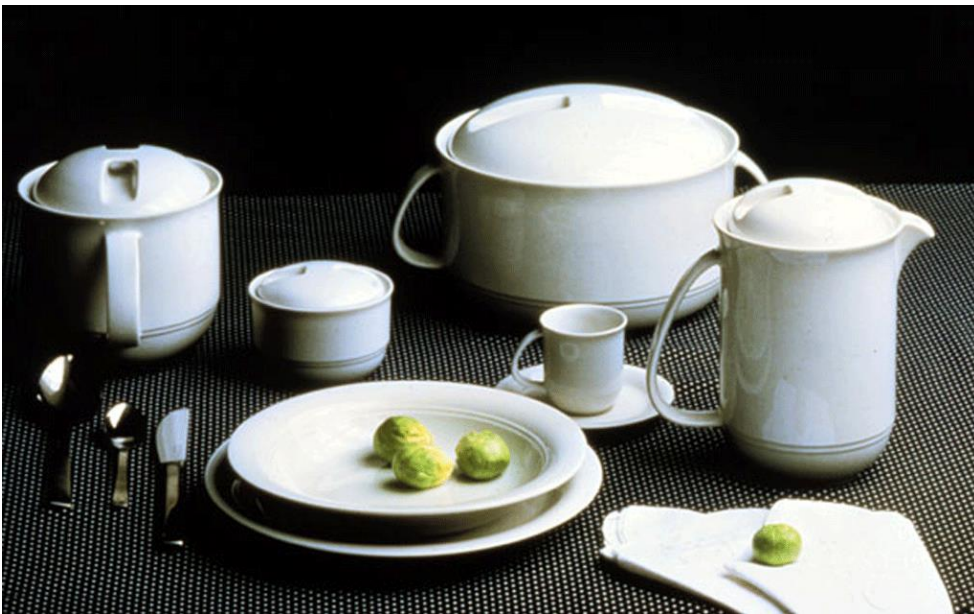
Linea tavola logo Tognana