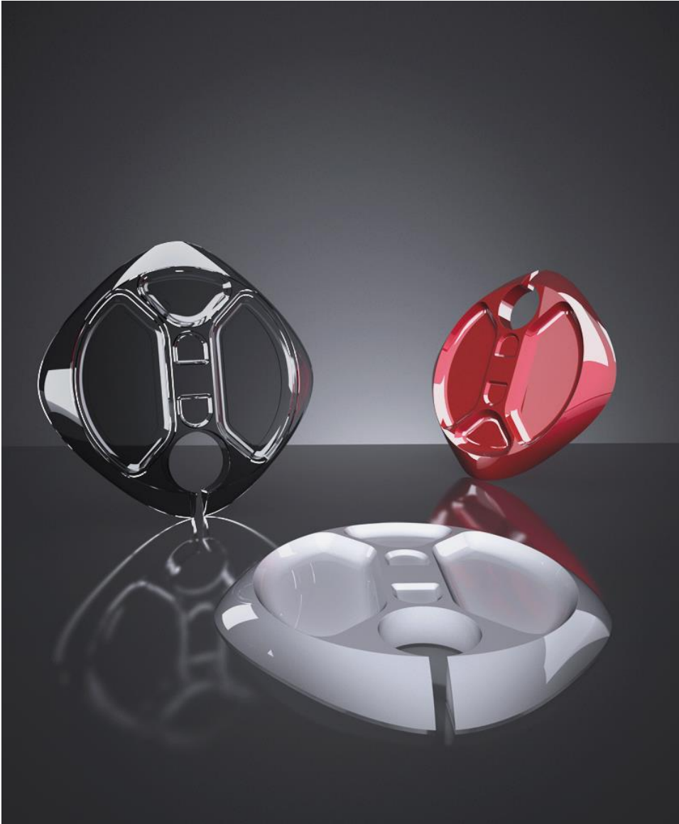
Piatto Party Biesse